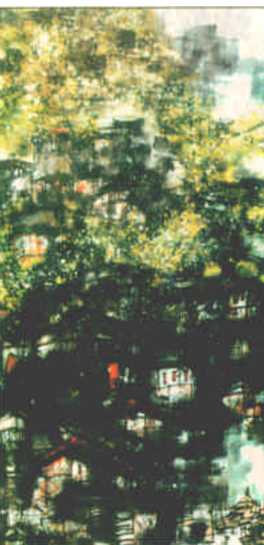
南国风光 韦公衡作