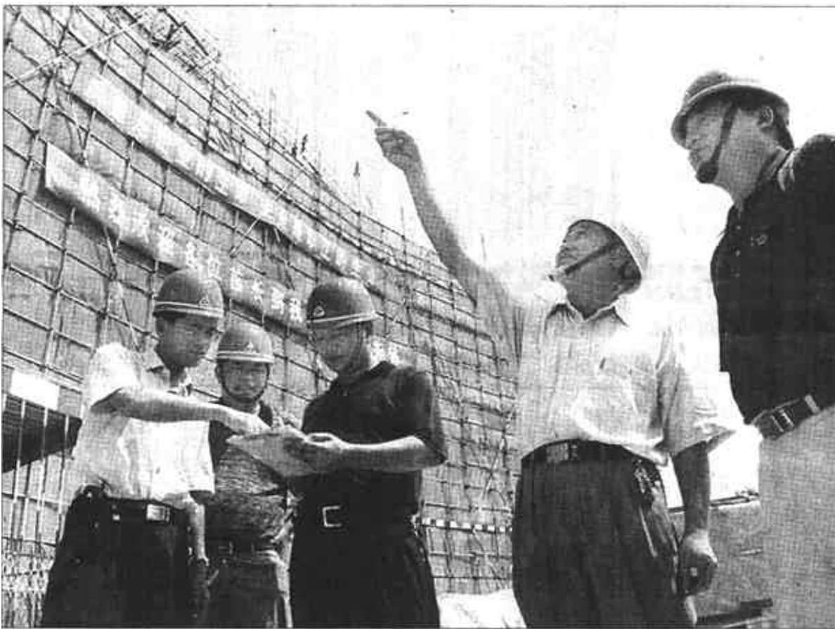
市建委坚持“安全第一、预防为主”和“以人为本”的方针,认真落实安全生产责任制,加强安全生产监督机构建设,深入开展创建全国文明工地活动和起重机械等多发性事故的专项治理。目前,全市工程建设安全生产保持了平稳态势。