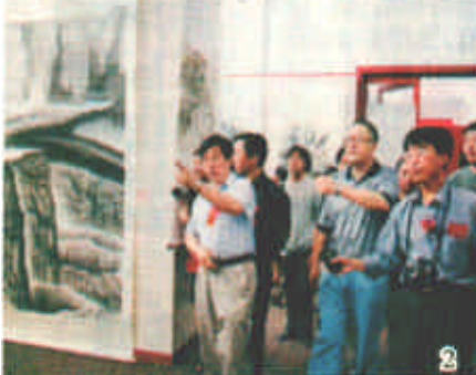
图二 参观、点评学员作品